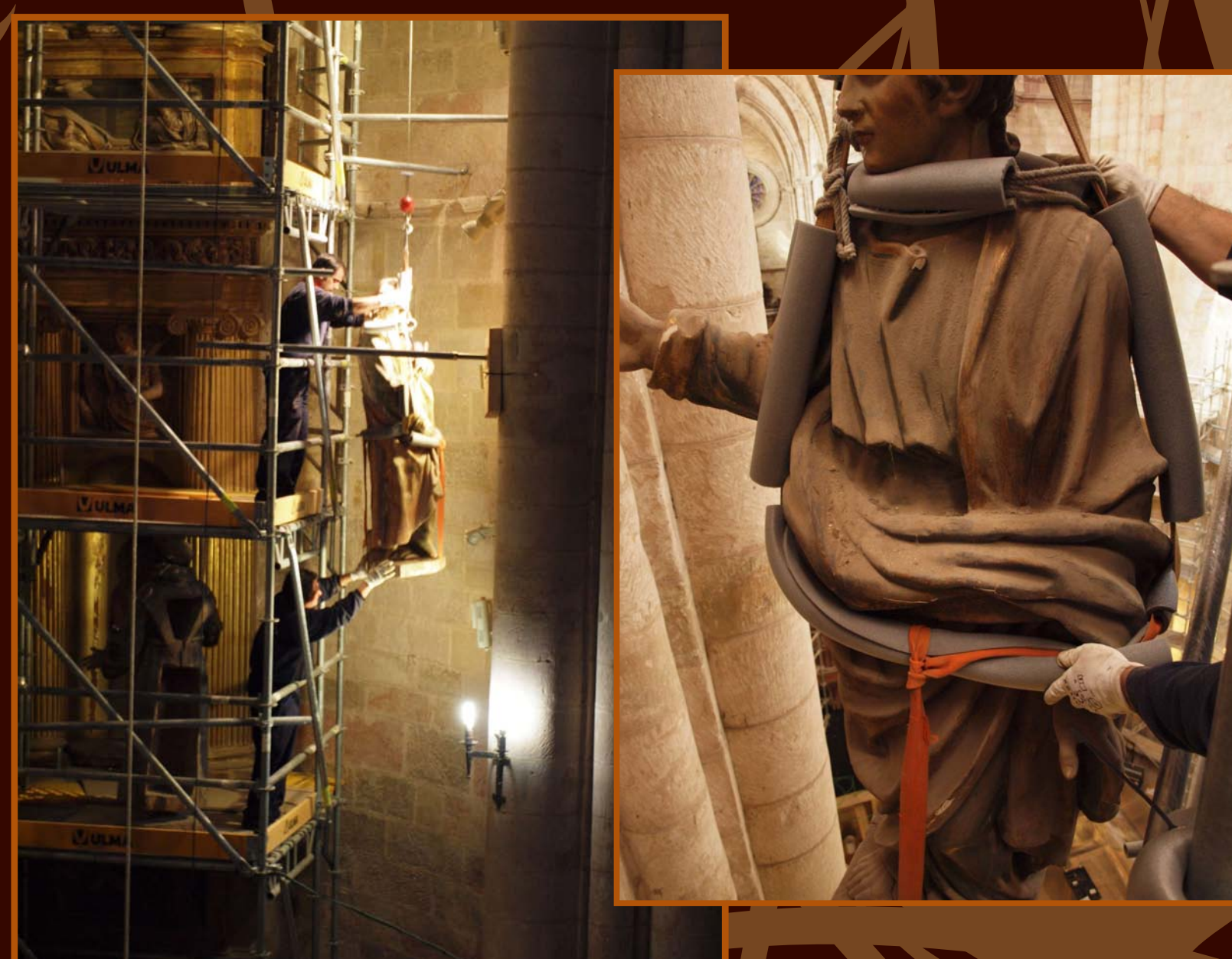
Detalle de limpieza química y mecánica en la mano izquierda de la Virgen del Calvario.

Para ello se forma un equipo interdisciplinar : restaurador, historiador, carpintero, químico, físico...Una vez establecido el diagnóstico se selecciona el procedimiento de actuación, la metodología de trabajo y su orden.