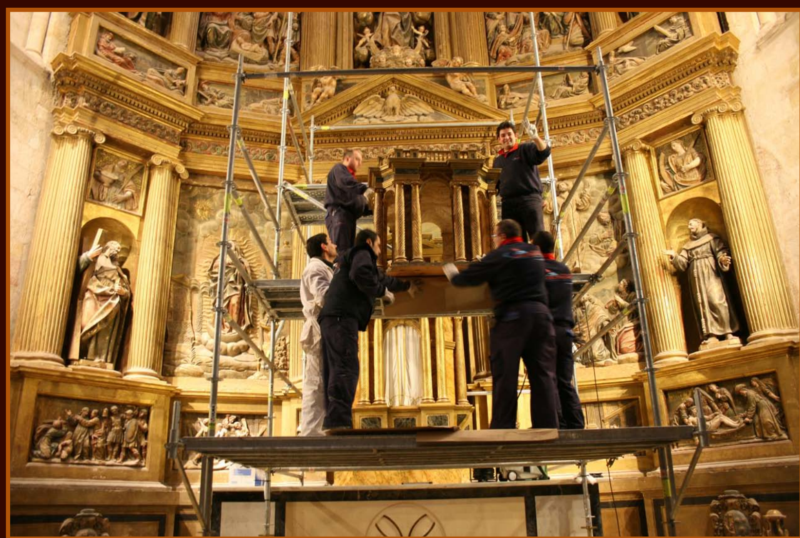
Sentado de color mediante espátula térmica en el rostro de la Virgen del Calvario

Los campos actuales de la gestión política en el terreno cultural y la difusión del Bien, son pilares sólidos sobre los que deben asentarse la formación y una educación social de mayores y pequeños.