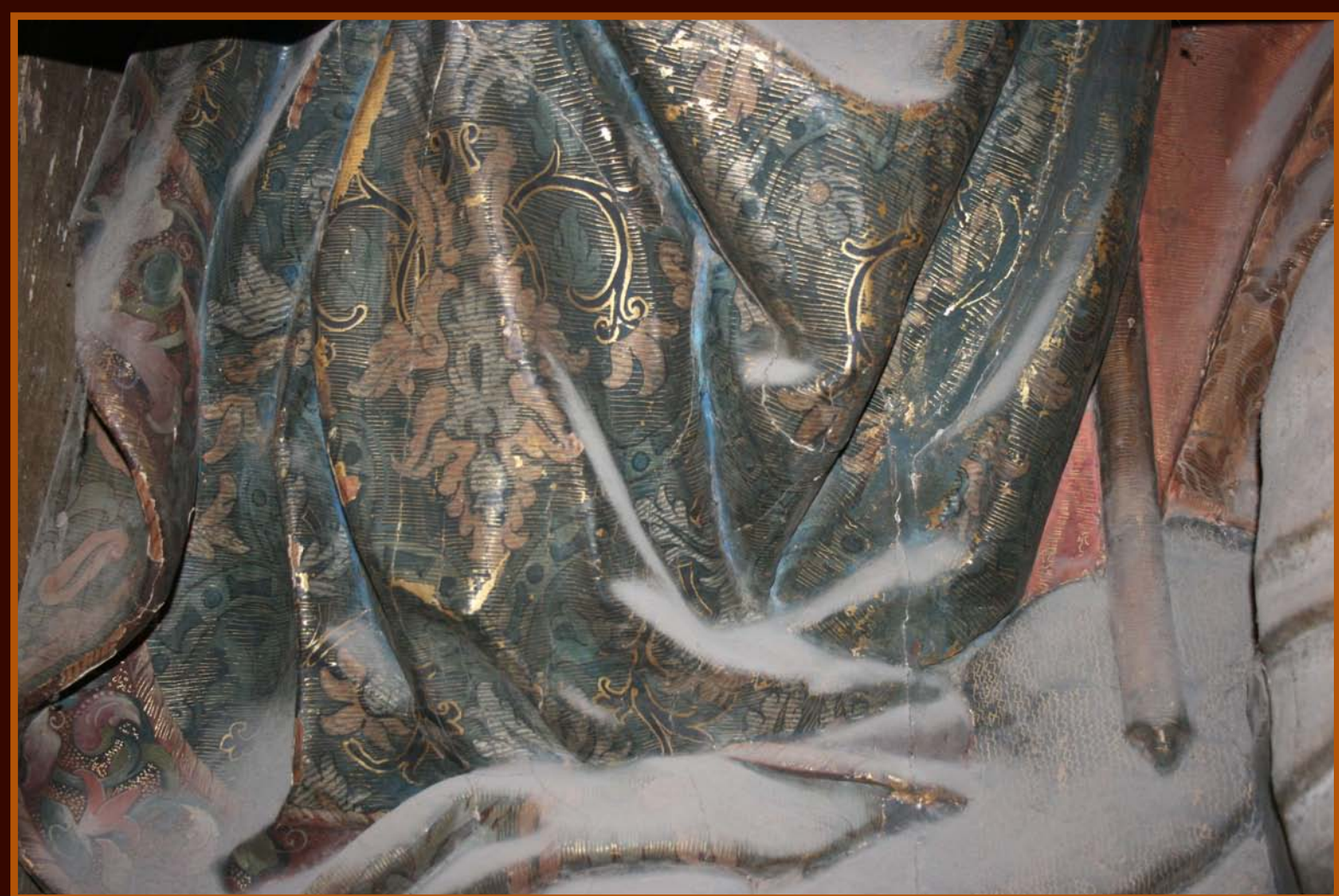
Detalle de los craquelados del ángel del Nacimiento de la Virgen. Atíco, escena izquierda.

El análisis del deterioro físico-químico que la ciencia nos aporta, y el conocimiento de la naturaleza del objeto y su historia material son los estudios previos acometidos en el inicio de este programa técnico de restauración.