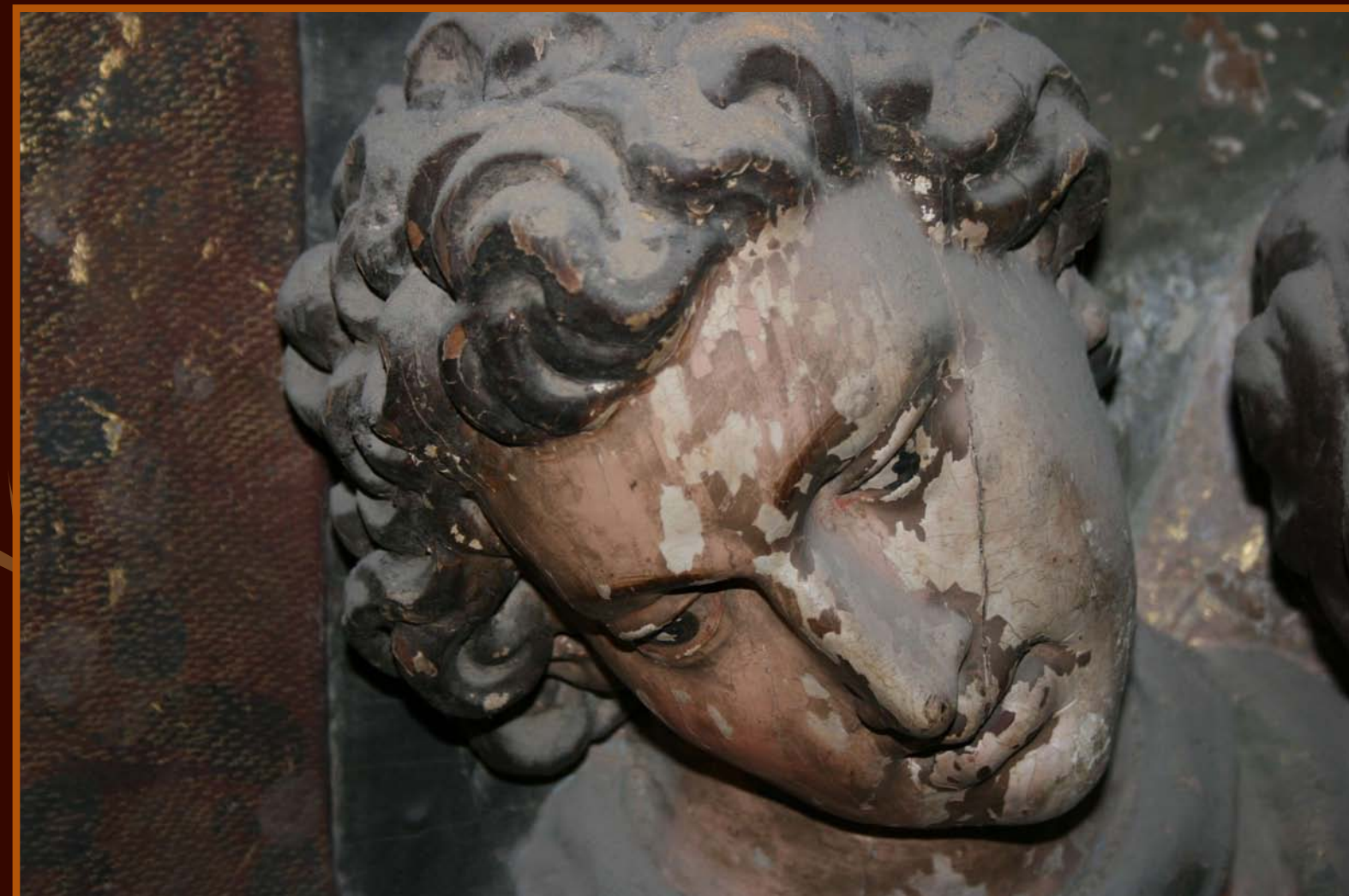
Momento de la toma de una micromuestra en el fondo de la imagen de la Ascensión.

La conservación es la primera intervención que se realiza en este Bien Mueble. Consiste en detener el deterioro y frenar sus patologías minimizando la actuación y conjugando las técnicas actuales con el saber tradicional de los métodos de ejecución.