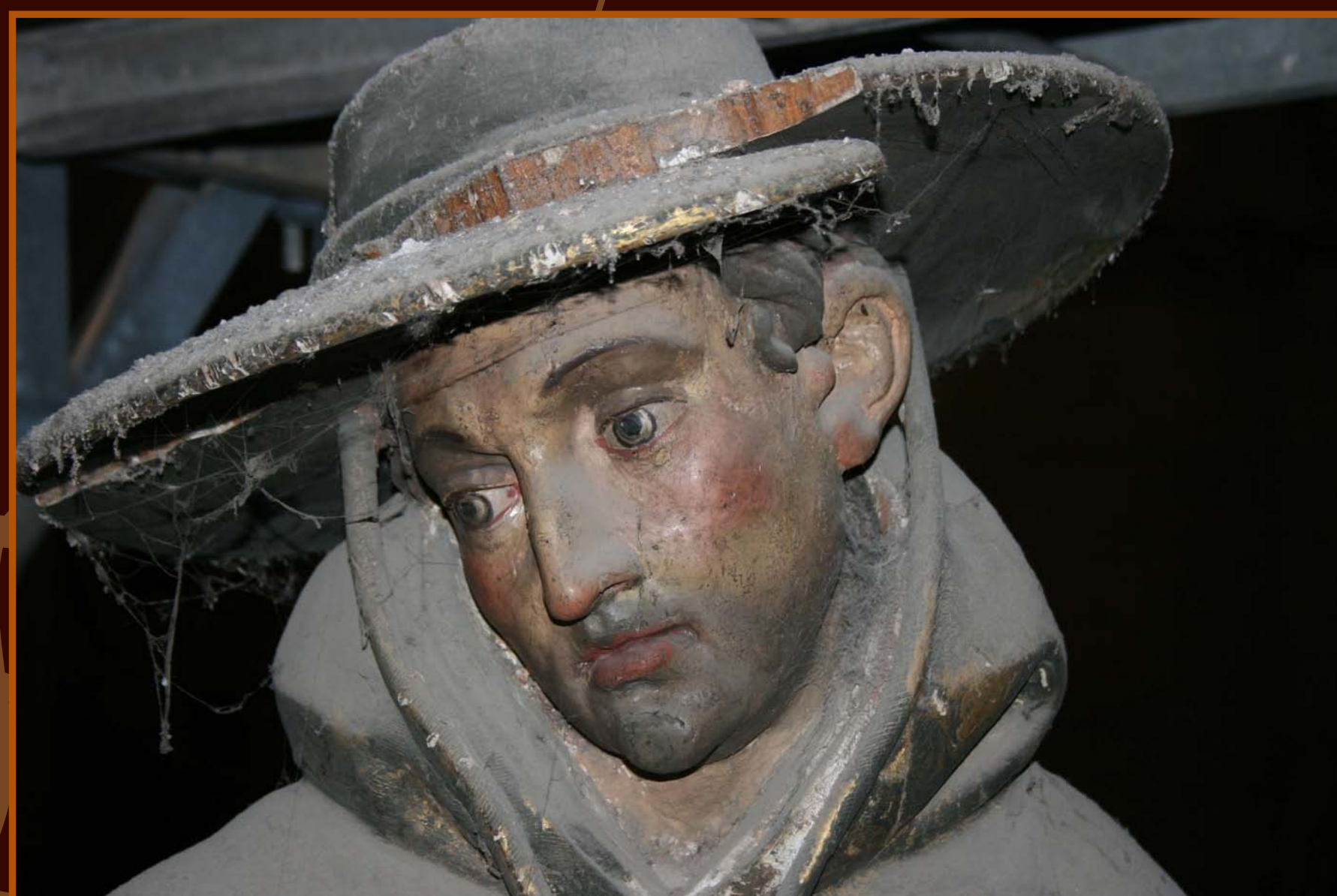
Rostro de la Virgen del Calvario después de la retirada de la película de barniz oxidado

Para ello se forma un equipo interdisciplinar : restaurador, historiador, carpintero, químico, físico...Una vez establecido el diagnóstico se selecciona el procedimiento de actuación, la metodología de trabajo y su orden.