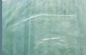
CONSOLIDACIÓN POR COSTURA