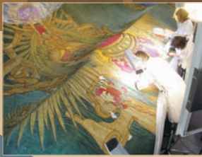
TOMA DE DATOS ESTADO DE CONSERVACIÓN