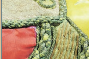
ANÁLISIS DE FIBRAS