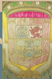
ANÁLISIS ELEMENTOS COMPOSITIVOS