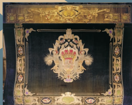
TELÓN Y BAMBALINÓN