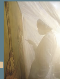
VAPOR POR ULTRASONIDO