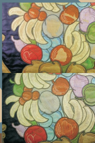
CONSOLIDACIÓN Y REINTEGRACIÓN