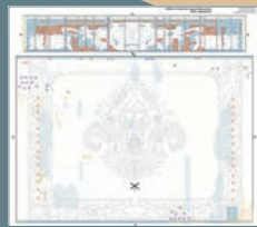
PLANIMETRÍAS Y GRÁFICOS