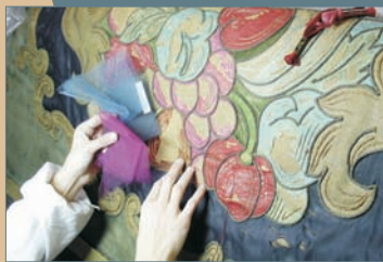
TINCIÓN Y ALINEADO DE SOPORTES