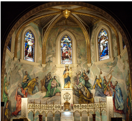
Imagen General del Conjunto DESPUÉS de su restauración.

Detalle del proceso de limpieza sobre el rostro. Figura de María Auxiliadora.