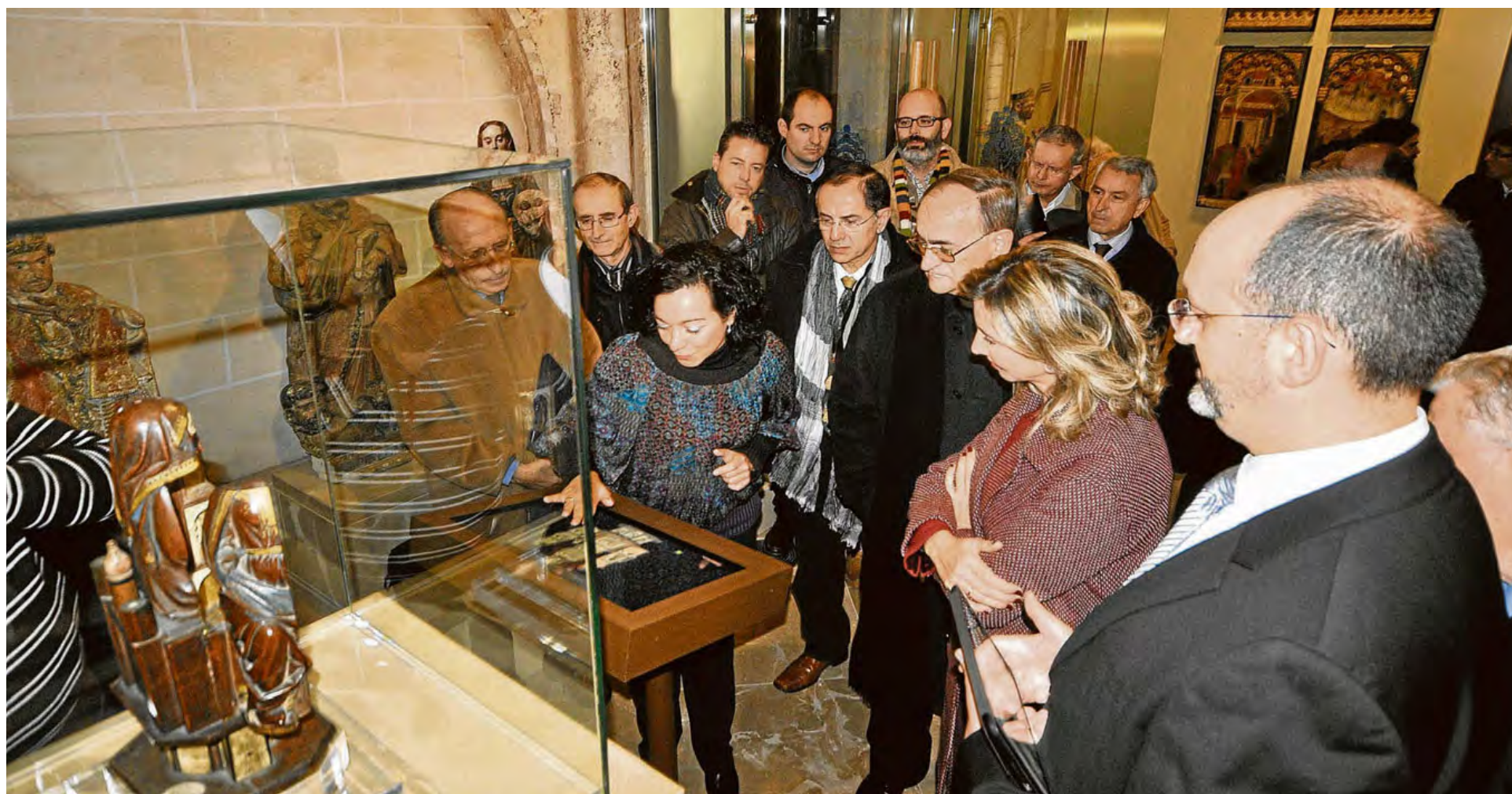
La responsable de la empresa de la musealización muestra a las instituciones una pantalla interactiva sobre una Virgen abridera del siglo XIII. | REP. GRAF:BARROSO