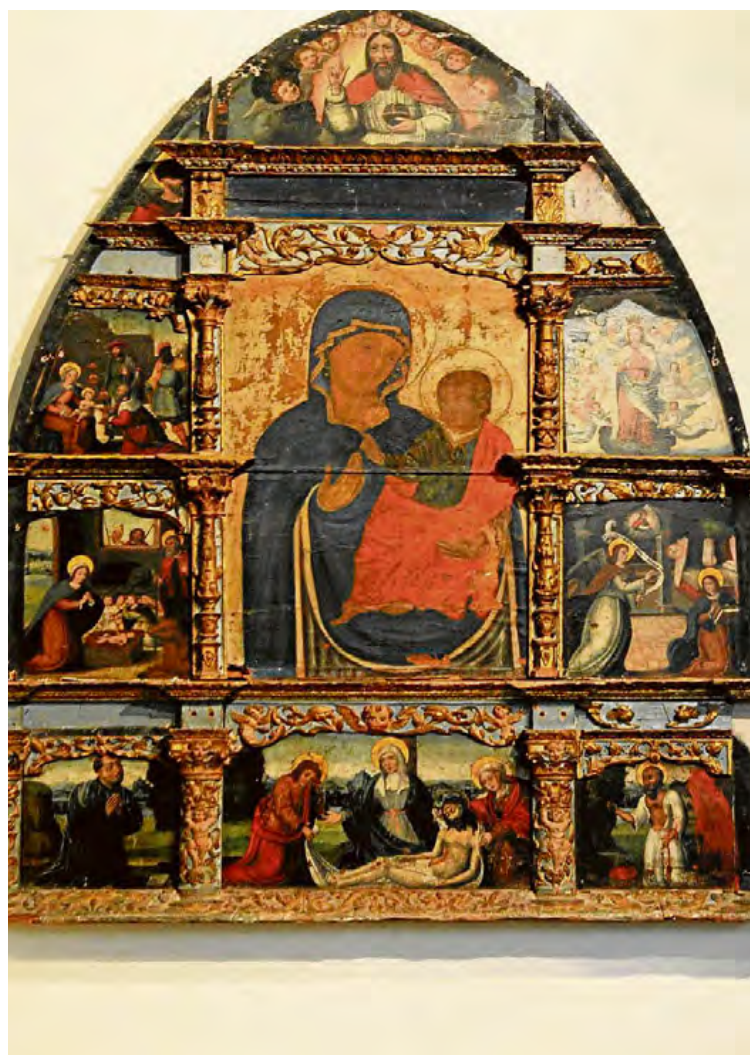
La Virgen del Pópolo ya se encuentra en los talleres de Simancas.

El prelado incidió en que era “un proyecto largamente deseado” y recordó que “mantener los tesoros artísticos va más allá de la Iglesia y solo se puede con la ayuda de la administración pública”. “Los bienes tienen una finalidad religiosa y artística y se encuentran a disposición de todos”, señaló.