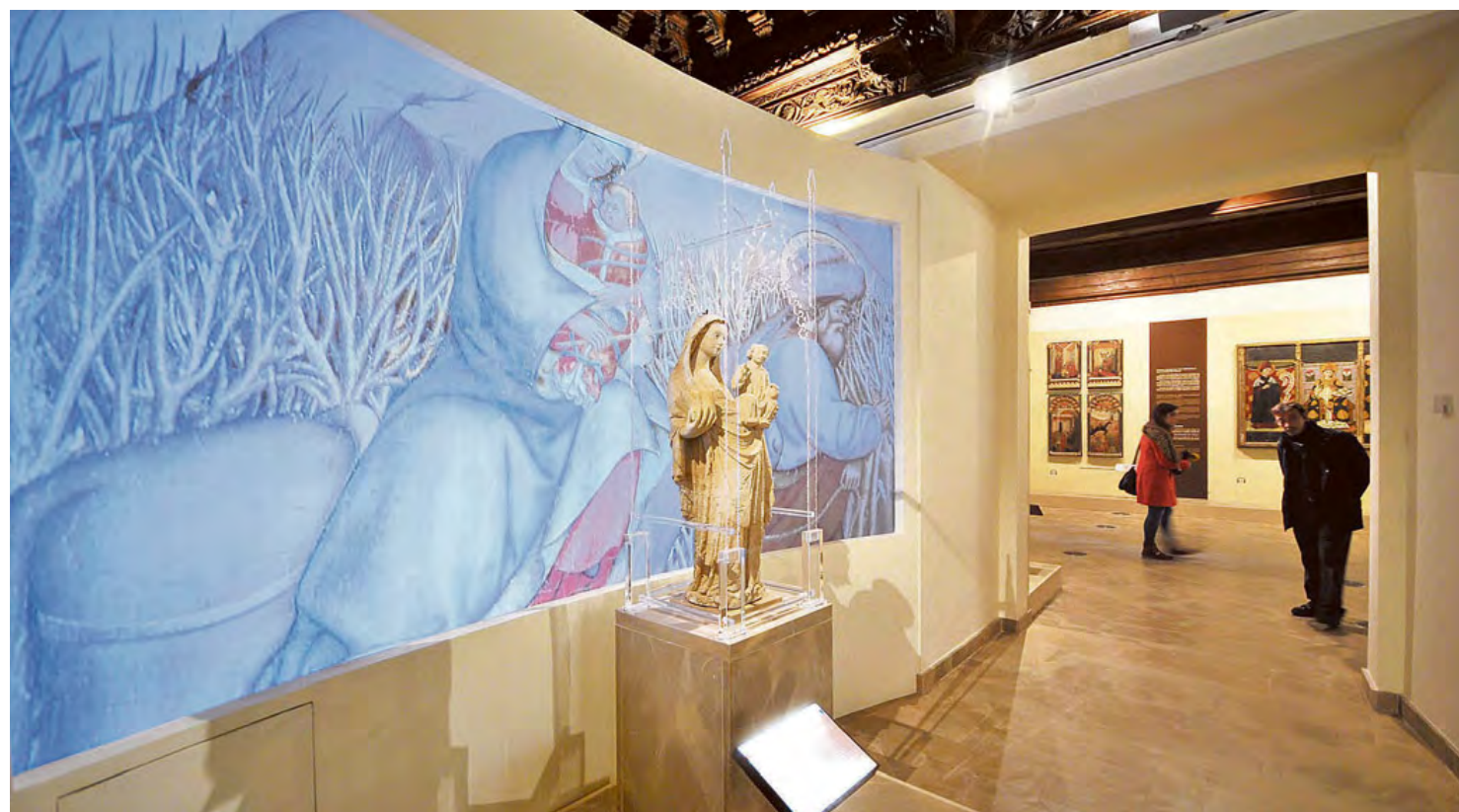
La Virgen de la Sede del siglo XIV junto a un montaje audiovisual del retablo de la Catedral Vieja. | ÓSCAR GARCÍA

Tras cuatro años de cierre, las salas capitulares se muestran hoy al público con los últimos avances en pantallas táctiles y tecnología QR ■ La Junta de Castilla y León se compromete a restaurar dos pinturas del siglo XVI