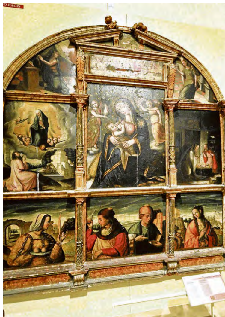
Retablo de la Virgen de la Leche que también se restaurará.