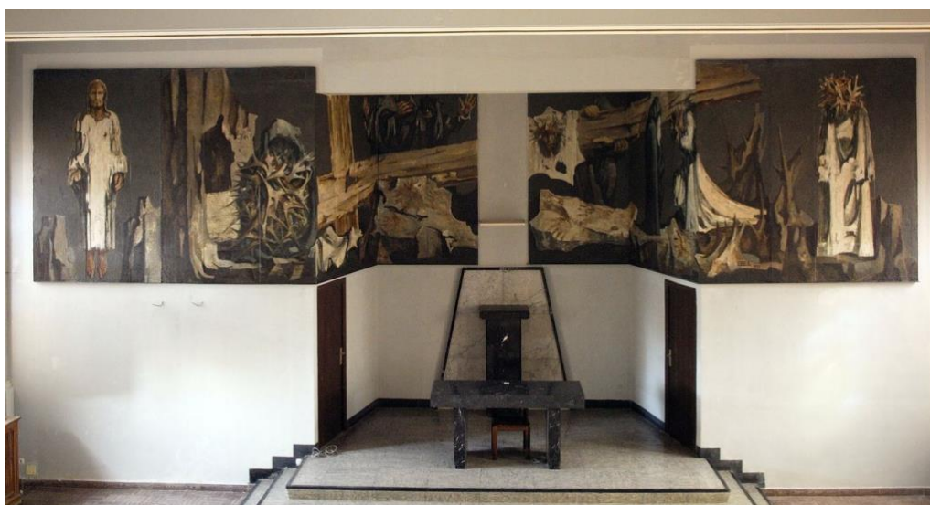
Fotografía realizada en el Hospital de los Montalvos una vez finalizados los trabajos de extracción, colocación y tratamiento del estrato pictórico.

Con motivo de la construcción del hospital nuevo y la demolición del hospital clínico universitario antiguo, se determinó conservar este Vía Crucis de Genaro de No realizado para esta capilla colocándolo en una nueva ubicación, el hospital de los Montalvos.