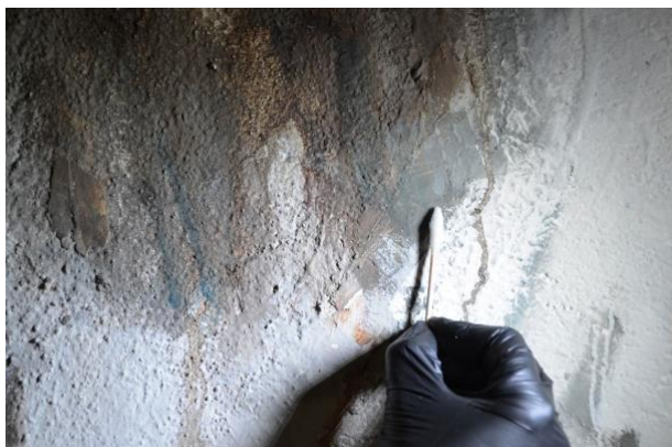
Fotografía realizada durante el proceso de la limpieza química del estrato pictórico.

Primeramente, fue necesario eliminar el engasado , bien de manera mecánica, bien mediante el reblandecimiento del adhesivo. Una vez retirado, sobre los restos que quedaron en superficie se realizó una limpieza química hasta conseguir la completa eliminación de los mismos. Se extrajeran los elementos espurios como puntas y clavos metálicos. En la parte inferior de la pintura, en el lateral izquierdo se eliminaron restos de cera solidificada fruto de la antigua colocación de velas.