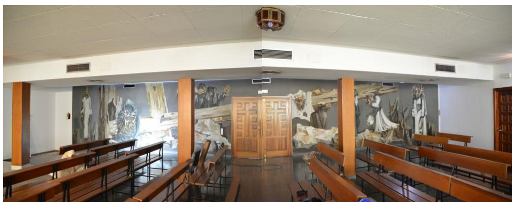
Vía Crucis realizado por Genaro de No para la capilla del antiguo hospital clínico universitario.

En esta pintura mural, realizada en 1975 para la capilla del antiguo hospital clínico de Salamanca un año antes de su inauguración, el artista plasma las técnicas más modernas en la pintura sobre pared, reflejando también un gran dominio espacial al igual que un lenguaje narrativo destacado por lo simbólico y emotivo, caracterizado todo por el fuerte expresionismo de las figuras. La firma con su nombre y fecha de ejecución se observa a los pies de las dos primeras estaciones del mural.