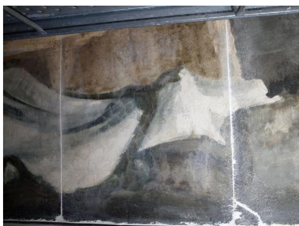
Reintegración de separación de paneles, grietas y volúmenes faltantes mediante mortero.