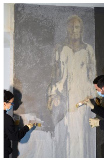
Fotografía realizada durante el proceso de engasado.

Teniendo en cuenta los resultados obtenidos, se procedió primeramente a la protección de toda la superficie mural empleando para ello una resina de bajo peso molecular disuelta en un hidrocarburo a una proporción ensayada previamente.