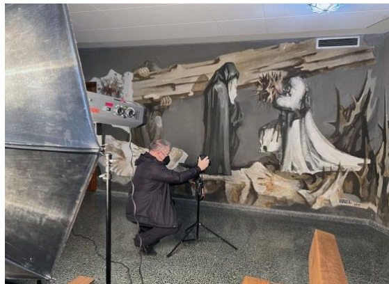
Registro fotográfico antes de la intervención.

Posteriormente, fueron necesarias realizar tanto pruebas de solubilidad de pigmentos como un testado de materiales -mediante la extracción de muestras - que nos garantizara una buena ejecución de los trabajos.