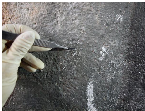
Detalle de la eliminación de restos de cera mediante limpieza química con bisturí.

Posteriormente, se llevó a cabo el sellado de la separación de los paneles mediante mortero, también se realizó la reintegración del volumen perdido en la parte superior de la pintura mural y se rellenaron oquedades o orificios en superficie. Las grietas que existían se trataron de la misma manera realizando posteriormente sobre estas zonas un entonado cromático con acuarela calidad de artista. Esta reintegración cromática se realizó también sobre aquellas zonas de desgastes que ofrecían discontinuidad al conjunto pictórico. Finalmente, se procedió a la protección superficial de la pintura mural mediante la impregnación de un barniz de bajo peso molecular disuelto en un hidrocarburo a una proporción ensayada con anterioridad tras las pruebas realizadas. Para homogeneizar brillos, fue necesario la nebulización del barniz de acabado satinado. Sobre aquellas zonas entonadas cromáticamente, que tras la aplicación del barniz viraron los colores por saturación de los mismos, se llevó a cabo una reintegración con pigmentos al barniz.