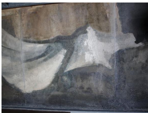
Reintegración cromática realizada sobre la misma zona donde se puede observar el entonado final de la pintura mural.