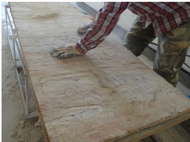
En esta fotografía se puede observar el rebaje del grosor del panel.

Una vez en el centro de trabajo, se llevó a cabo el tratamiento de la trasera de cada panel mediante el rebaje del grosor del ladrillo que configuraba el muro constructivo de la capilla, creando una superficie homogénea que garantizara la planitud de los mismos en el nuevo emplazamiento. Posteriormente, sobre esta trasera y sobre la pared se aplicó un mortero de adhesión asegurándonos una buena unión que se reforzó hasta el fraguado de los materiales mediante puntales.