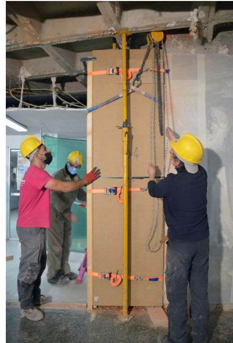
Proceso de extracción de uno de los paneles.

Debido al peso de los mismos, fue necesario un polipasto instalado en el techo que nos permitiera la sujeción, manipulación y traslado de cada uno de ellos, colocándolos finalmente en una plataforma con ruedas para llevarlos al vehículo de transporte especializado.