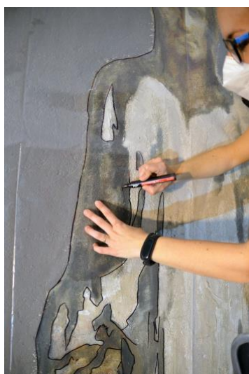
Proceso de realización de la plantilla del dibujo

También, se llevó a cabo una plantilla en la que se plasmó el dibujo del desarrollo de las escenas, marcando la división vertical de los 21 paneles donde se iban a realizar los cortes del muro para poder realizar la extracción de los mismos, calculando peso y dimensiones.