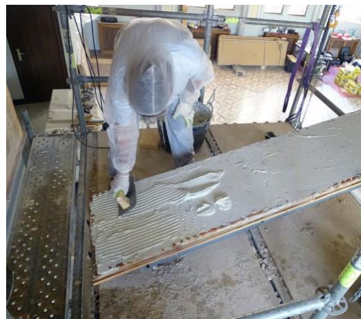
Proceso de aplicación del adhesivo para posteriormente unir el panel al muro de la capilla.